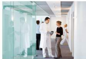
Eine umfassende Beratung ist für die Zahnklinik ABC Bogen selbstverständlich.

Zahnarzt: Lieber Patient, ich freue mich doch eigentlich, wenn ich für Sie etwas tun und Ihnen helfen kann. Das ist mein Beruf und dieser macht mir sehr viel Spaß. Egal, was ist, die passenden Fachärzte sind hier bei uns im Haus. Um eine Diagnose stellen zu können, fertigen wir einen klinischen, röntgenologischen und parodontologische Befund an. Das sind die Grundpfeiler für ein Konzept über Ihre anschließende Therapie, dass Ihre gesamte Mundgesundheit umfasst.