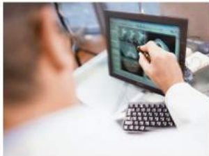
Das Expertenteam der Zahnklinik ABC Bogen ermöglicht seinen Patienten eine individuelle Behandlung und nimmt eine umfassende Beratung vor.

Der erste Schritt des Konzeptes dient dazu, ein gesundes Zahnbett zu erzeugen. Parodontale Erkrankungen können auch zu Lockerungen oder gar zu Zahnverlust führen.